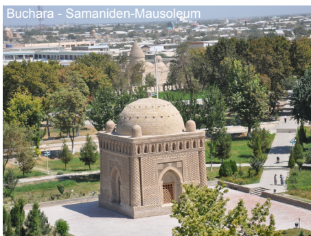
Buchara - Samaniden-Mausoleum