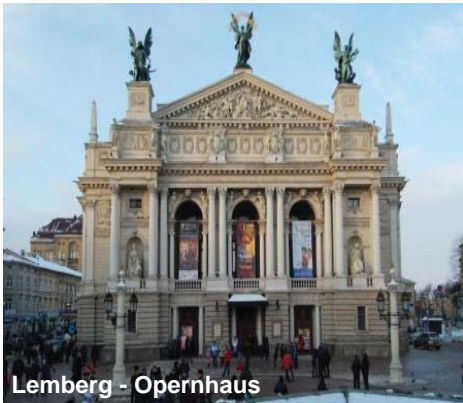
Lemberg - Opernhaus