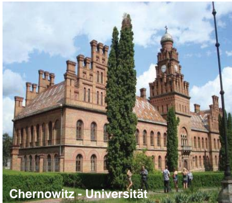
Chernowitz - Universität