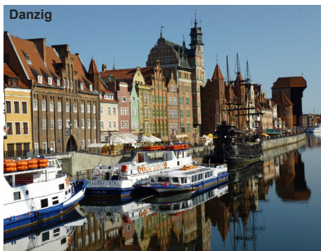
Reise-Nr. ÖK PL-7012