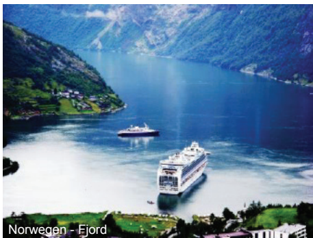
Norwegen - Fjord