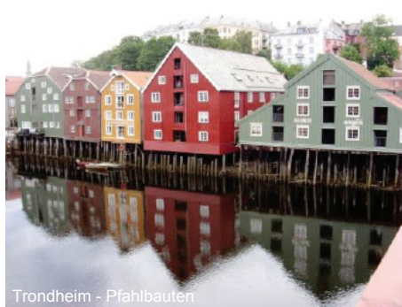
Trondheim - Pfahlbauten