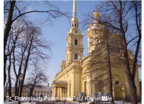
St. Petersburg Peter- und Paul Kathedrale