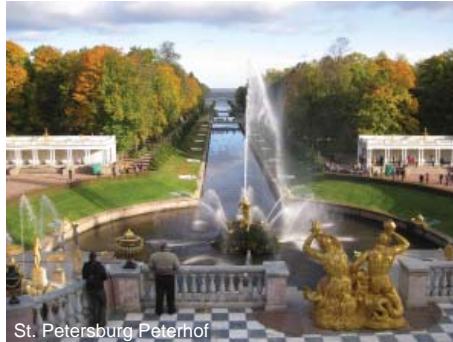
St. Petersburg Peterhof