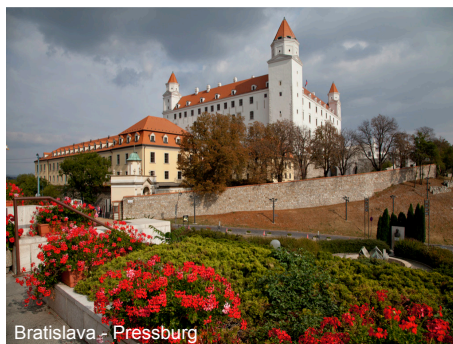
Bratislava - Pressburg