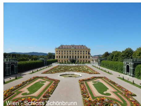
Wien - Schloss Schönbrunn

6. Tag: Fahrt zum Schloss Schönbrunn , dem ehemaligen Lust- und Jagdschloss der Habsburger. Unterwegs kurzer Stopp beim Schloss Belvedere . Besichtigung des Schlosses Schönbrunn