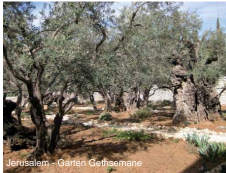
Jerusalem - Garten Gethsemane